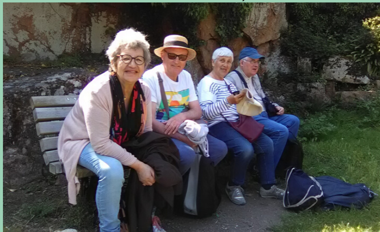
Une petite pause avant de se remettre en chemin...

SORTIE SUR L'ÎLE DE BRÉHAT, LE 22 MAI 2019