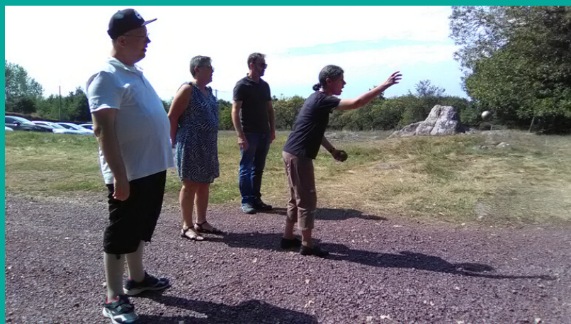
Une partie de pétanque près du château de Comper