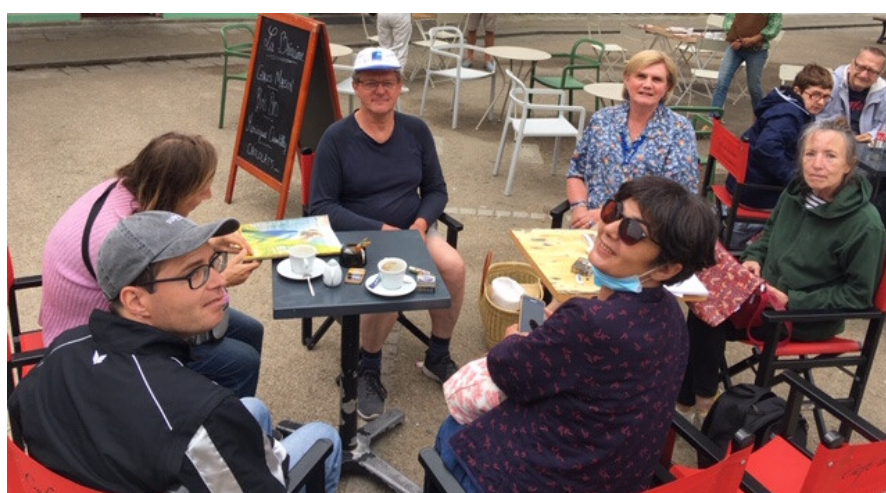
ST BRIAC SUR MER