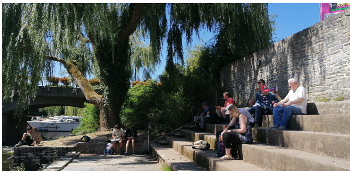
EXPO A LA GACILLY